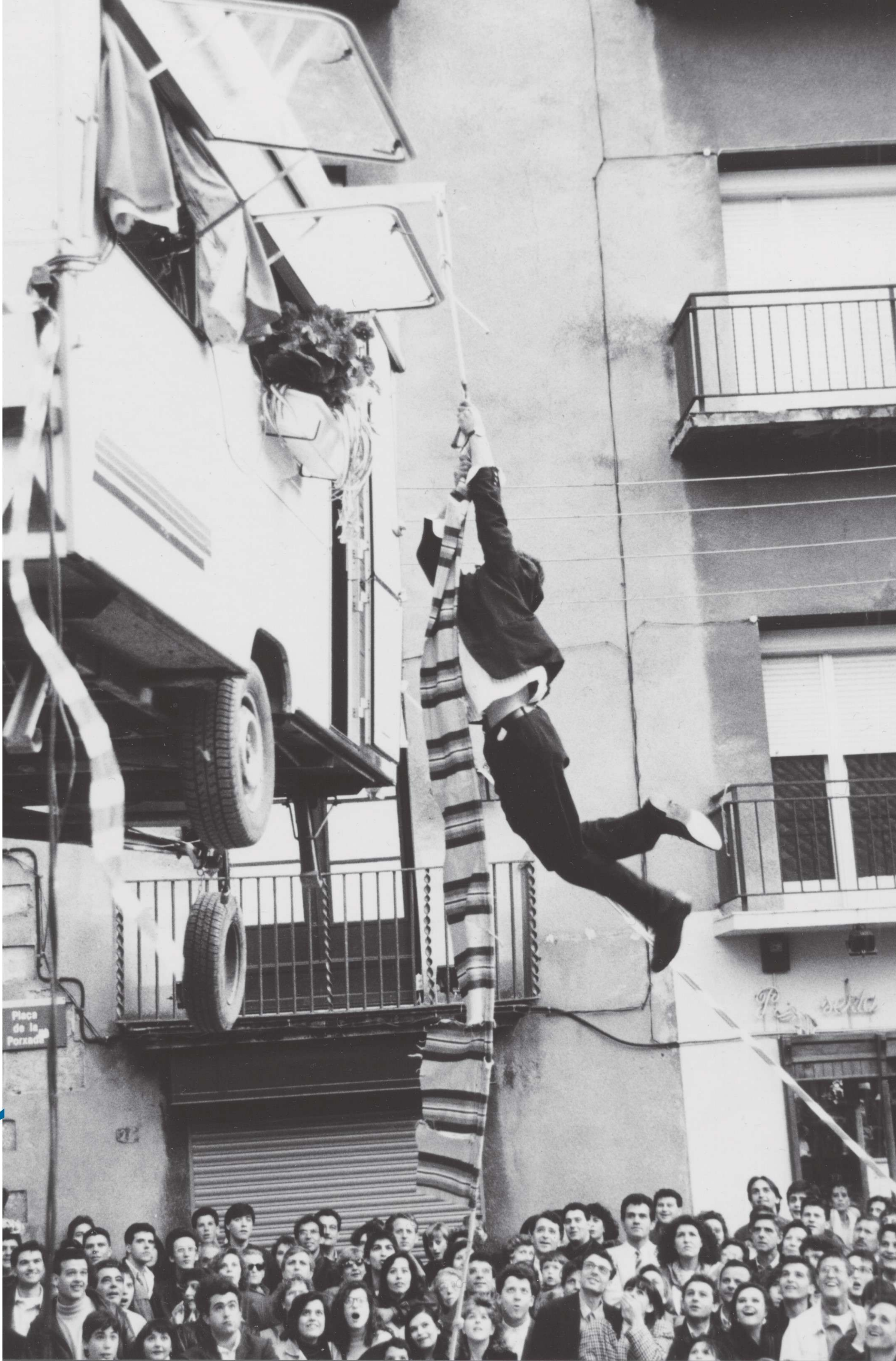
ÉS AQUEST OCELL UNA RULOT?. DE CIRC PERILLÓS / © SANTI MORATÓ I DENIS CALVARONS, 1991